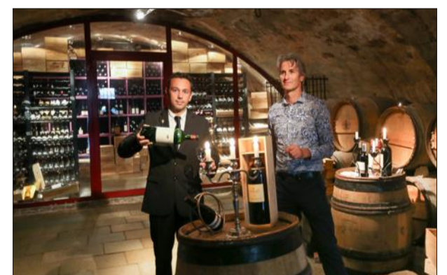
La cave du Château est ouverte tous les jours pour des dégustations.

Avec 18 000 bouteilles et 500 références de toutes les régions de France, le Château est un peu, aussi, un musée du vin. Mais un musée vivant où le vin se boit ! Tous les soirs, à 18 heures, un des sommeliers organise une dégustation de trois vins et, toute l'année, des menus et dégustations permettent de découvrir cinq vins présentés par des professionnels :