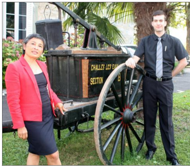
Cette pompe à bras datant de 1890 est de type aspirante-foulante. Sa portée était de 32 mètres, avec une cuve de 256 litres. Elle provient de la commune de Challes-Les-Eaux.

Jusqu'à la fin du mois d'octobre, l'antique demeure des Comtes de Challes, transformée par la volonté de la famille Trèves en un hôtel de charme et restaurant gastronomique, sert de décor à une exposition d'une dizaine de matériels incendie datant tous du XIX e siècle.