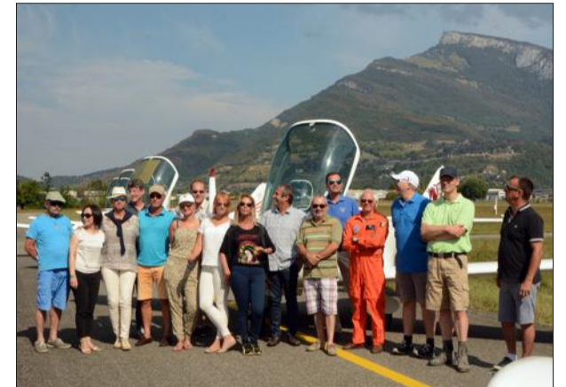
Du 10 au 17 septembre le Château accueille une vingtaine de pilotes venus se former au vol en montagne.

Depuis plusieurs années maintenant, le Château propose, à travers ses cofrets cadeaux, des baptêmes aériens, le survol des lacs du Bourget et d'Anney en double commande ou le tour du mont Blanc.